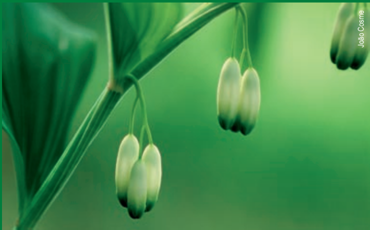
Selo de salomão - Polygonatum verticillatum

A beleza natural desta zona, em conjunto com os inúmeros testemunhos históricos que vamos encontrando, tornam este percurso inesquecível. Aqui, levamo-lo a descobrir as margens de dois dos principais cursos de água deste concelho: o rio Couto e o rio Alfusqueiro. A beleza agreste e a frescura destes cursos de água, com imponentes blocos rochosos cobertos de musgos e fetos reais, formam um quadro de beleza inigualável, criando corredores húmidos de enorme riqueza em biodiversidade. A acompanhar estas águas revoltas e límpidas, um magnífico bosque ribeirinho resiste e serve de abrigo a uma grande diversidade de animais. Inúmeros amieiros, salgueiros e freixos crescem exuberantes nas suas margens e presenteiam-nos com uma agradável frescura. Junto às povoações, o Homem moldou a paisagem e a agricultura ganhou espaço com extensos campos de milho, vinha e árvores de fruto. É notável a predominância de arvoredos de folha caduca, nomeadamente carvalhos e castanheiros que ocupam as encostas mais declivosas. A par destes magníficos exemplares da nossa flora caducifólia, é, ainda, frequente a ocorrência do selo de salomão e de algumas orquídeas, fáceis de reconhecer durante a floração.