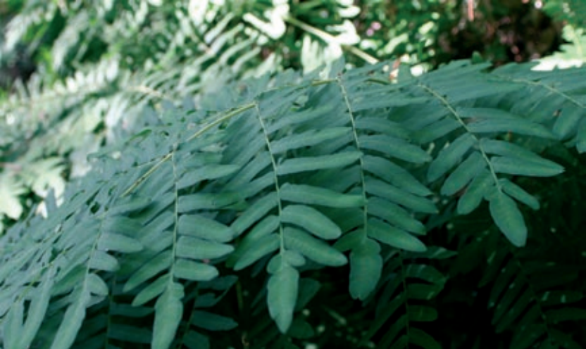
Feto real - Osmunda regalis